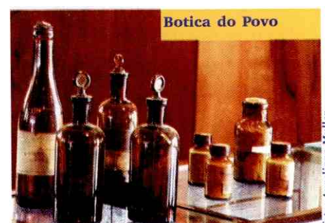
Botica do Povo