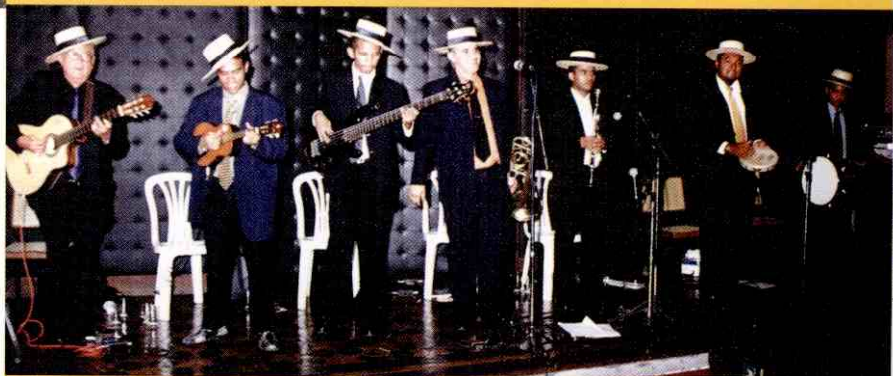
Um conjunto com o figurino de epoca animou o evento