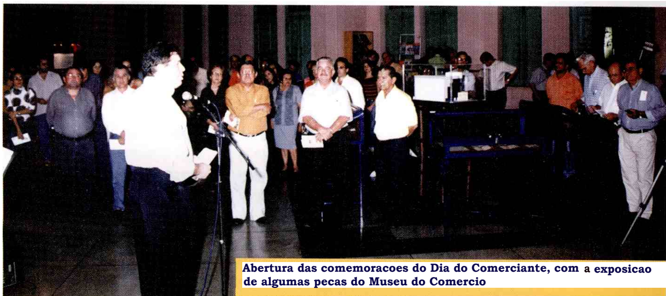
Abertura das comemoracoes do Dia do Comerciante, com a exposicao de algumas pecas do Museu do Comercio

O dia 16 de julho homenageia o Comerciante e a CDL de Teresina decidiu comemorar a data lancando, na vespera, uma exposicao sobre a história do comercio piauiense. Alem dos motivos historicos, a exposicao teve como objetivo prestigiar e valorizar o trabalho dos lojistas e, por isso, nada melhor que la junto ao dia do comerciante.